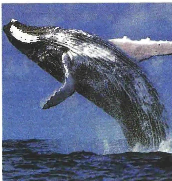
«Καμπουρωτή» φάλαινα πηδά με χάρη έξω από το νερό

πίσει. Ωστόσο, σε αυτή τη νουβέλα η φάλαινα δεν είναι ο κακός της ιστορίας. Οικολογικά θρίλερ σχετικά με την κόντρα ανθρώπου-φύσης είναι τόσο παλιά όσο και οι ελληνικοί μύθοι αλλά και η ίδια η ανθρώπινη φαντασία. Κι ενώ αυτές οι ιστορίες παλιότερα έδειχναν ότι ο άνθρωπος είναι στο έλεος της φύσης, σήμερα τέτοιες ιστορίες μάς υπενθυμίζουν ότι η φύση βρίσκεται πλέον στο έλεος της ανθρωπότητας».