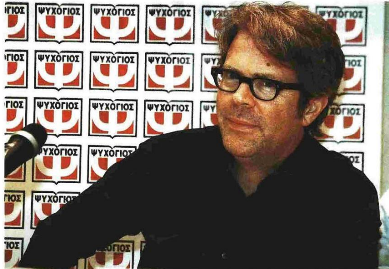
Ο 55χρονος αμερικανός συγγραφέας Τζοναθαν Φράντζεν βρέθηκε προ ημερών στην Αθήνα και μίλησε για το έργο του, το ενδιαφέρον του για την οικολογία, την τεχνολογία ή τους αγαπημένους του γερμανούς συγγραφείς

όποιον παρακολούθησε τις εκπομπές της Οπρά Γουίνφρεϊ. Το κοινό από τη μεριά του δεν ήταν πλέον μόνο φιλικά διακεκμενο, με συνθετότερη κατηγορία τη ροπή προς τη δημοσιότητα. «Απλώς μου άρεσε να με προσέχουν» αναφώνουσε ο συγγραφέας σε παλιότερη συνέντευξή του, συμπληρώνοντας ωστόσο ότι η τήση αυτή εξισορροπείται από μια ανάγκη για μοναξιά. Ποια από τις δύο επικρατεί σήμερα; Ίσως να πρόκειται για μείγμα: σε εκείνη ας πούμε την εκδίδωσα στην Ελληνοαμερικανική Έκδοση, οι απαντήσεις του ήταν κατά κανόνα προσηκτικές και σοβαρές. Φανερά μέρμηνα τού ωστόσο, σε μια εποχή που η εικόνα και η διατήρησή της παίζουν κάτι παραπάνω από σημαντικό ρόλο, ήταν να περιλαμβάνουν οπισοδηψότε και μια κιομηριστική χροιά. Ενα εξίσου προσεκτικό και πετυχημένο στείλο.