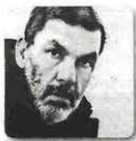
γράφει ο ΘΑΝΑΣΗΣ ΛΑΛΑΣ

Ένας από τους σημαντικότερους εν ζωή συγγραφείς μιλά στη Realnews . Αγαπώ αυτόν τον συγγραφέα και δεν ξέρω αν είναι ο νέος Τολστόι, ξέρω όμως ότι όποτε τον διαβάζω δεν θέλω να τελειώσει η αφήγησή του. Νιώθω ότι γύρισε ένας επιστήθιος, ενδιαφέρων φίλος από ταξίδι και ήρθε φορτωμένος αφηγήσεις. Αυτή τη φορά, λοιπόν, ασχολήθηκα με την αυτοπροσώπως. Αν δεν έχετε διαβάσει την «Ελευθερία» και τις «Διορθώσεις», αναζητήστε τα. Δύο βιβλία-μυθιστορήματα που τον έκαναν κύριο στο λογοτεχνικό σύμπαν. Για τις «Διορθώσεις» ερωτήθηκε πολλές φορές εάν είναι αυτοβιογραφικό. Ποτέ δεν έδωσε σαφή απάντηση. Πάντοτε υπομειδιούσε υπεκφύ-