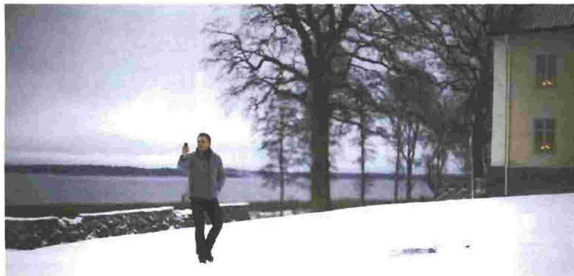
Από τον Γιώργο Νάστο

Οι εκ Βορρά ορμώμενοι συγγραφείς κατακτούν τον κόσμο – και το Χόλιγουντ – με σκοτεινά αστυνομικά μυθιστορήματα.