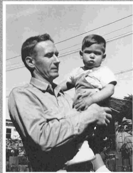
Ο Paul Jobs με τον Steve, 1956

Προς το τέλος της τετάρτης δημοτικού, η κυρία Hill έβαλε να του κάνουν τεστ νοημοσύνης. «Το σκορ που πέτυχα ήταν στα επίπεδα της δευτέρας γυμνασίου», θυμάται ο Jobs. Τώρα που ήταν φανερό, όχι μόνο στον ίδιο και στους γονείς του αλλά και στους δασκάλους επίσης, ότι ξεχώριζε από τα άλλα παιδιά, το σχολείο έκανε μια εντυπωσιακή πρόταση: να του επιτρέψουν να παραλείψει δύο τάξεις και να πάει από το τέλος της τετάρτης δημοτικού κατευθείαν στην πρώτη γυμνασίου. Αυτός ήταν ο πιο εύκολος τρόπος για να μπορούν να του προσφέρουν δύσκολες και ενδιαφέρουσες προκλήσεις. Οι γονείς του αποφάσισαν, πιο συνετά, να παραλείψει μόνο μία τάξη.