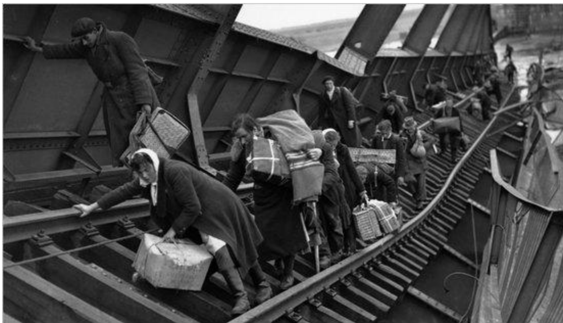
Πρόσφυγες περνούν γκρεμισμένη γέφυρα στον ποταμό Έλμπε στην Tangermünde, την 1η Μαΐου του 1945.

Ο συγγραφέας αναφέρει επίσης λεπτομερώς τι συνέβη μετά τον πόλεμο στη Γερμανία, την Ιταλία, την Πολωνία, τη Γιουγκοσλαβία, την Ουκρανία, και όλα τα άλλα μέρη όπου ο πόλεμος συνεχίστηκε με τα ίδια ή και με χειρότερα μέσα. Στοχάζεται τι σημαίνει εθνικιστικό μίσος, πώς κατασκευάστηκαν οι μύθοι του πολέμου, ποιες ήταν οι πολιτικές και ιδεολογικές συγκρούσεις Δεξιάς και Αριστεράς μετά τον πόλεμο και σε τι είδους καθεστώτα οδήγησαν, πώς διεξήχθη ο μεταπολεμικός «ανταγωνισμός θυματοποίησης», πώς φέρθηκαν οι νικητές στους «οριζόντιους συνεργάτες του εχθρού» (τις γυναίκες που κοιμούνταν με τους φασίστες) και πώς αντέδρασαν αυτές. Για παράδειγμα, η Γαλλίδα ηθοποιός Αρλετί δικαιολογήθηκε στη δίκη της ως εξής: «Η καρδιά μου ανήκει στη Γαλλία, αλλά ο κόλπος μου σε εμένα». Προφανώς δεν έπεισε τους δικαστές, αφού φυλακίστηκε για αυτό τον λόγο.