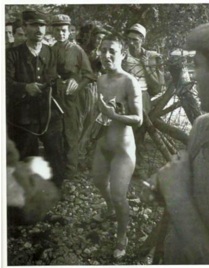
Κορσικανή που κατηγορήθηκε ότι συνευρισκόταν με Γερμανούς

Όσο για το «ηθικό τοπίο», είχε γίνει «αγνώριστο όσο και το φυσικό τοπίο». Τρομερό ενδιαφέρον παρουσιάζει το γεγονός ότι η εγκληματικότητα γνώρισε ραγδαία αύξηση ακόμα και στις ουδέτερες χώρες, στις οποίες οι άνθρωποι, μάλλον από μια «βαθιά αίσθηση άγχους», επιδίδονταν σε πράγματα που ειδάλλως δεν θα έκαναν. Όσο για τη βία, δεν υπάρχουν λέξεις για να περιγραφεί: ο συγγραφέας υποστηρίζει πως στον Δεύτερο Παγκόσμιο Πόλεμο συνέβησαν περισσότεροι βιασμοί σε σχέση με οποιονδήποτε άλλο πόλεμο στην ιστορία – βιασμοί που αυξάνονταν «παντού κατά τη διάρκεια του πολέμου, ακόμα και σε περιοχές όπου δεν σημειώνονταν μάχες». Αυτή η τραγωδία των γυναικών (που είχε ασφαλώς τρομακτικές επιπτώσεις και στους άνδρες τους) κορυφώθηκε στη Γερμανία αμέσως μετά τον πόλεμο, όπου υπολογίζεται ότι βιάστηκαν σχεδόν 2 εκατομμύρια Γερμανίδες, κυρίως από Σοβιετικούς στρατιώτες, ενώ παρά τις συνεχείς εκτρώσεις, γεννήθηκαν έως και 200.000 «ξένα μωρά».