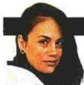
ΓΡΑΦΕΙ Η ΓΕΩΡΓΙΑ ΓΕΩΡΓΙΟΥ

Την άγνωστη και ξεχασμένη πόλη της αρχαιότητας ανατέμνει ο ομότιμος καθηγητής Ελληνικού Πολιτισμού στο Τμήμα Κλασικών Σπουδών του Πανεπιστημίου Κέιμπριτζ