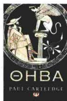
Paul Cartledge ΘΗΒΑ Η ΞΕΧΑΣΜΕΝΗ ΠΟΛΗ ΤΗΣ ΑΡΧΑΙΑΣ ΕΛΛΑΔΑΣ Μτφ. Γ. Μπλάνας, εκδ. Ψυχογιός, 2024, σελ. 336 Τιμή 27 ευρώ

αρκετούς συναδέλφους του συγγραφέα, μεταξύ αυτών αναφέρονται από τον ίδιο ο D.W. Berman ( Myth, Literature and the Creation of the Topography of Thebes , Cambridge, 2015) και ο N. Papazarkadas ( The Epigraphy and History of Boeotia: New Finds, New Prospects , Brill Studies in Greek and Roman Epigraphy, 4, Leiden; Boston: Brill, 2014). Στο πλαίσιο μελετών της περιοχής εντάσσεται και το σχετικά πρόσφατο βιβλίο του John M. Fossey « Biotia in Ancient Times. Some Studies of its Topography, History, Cults and Myths , Leiden; Boston: Brill, 2019» που συνιστά μια συγγραφική τομή στη μελέτη της βοιωτικής γης και ιστορίας. Ο Κάρτλετζ επιθυμεί με την έκδοσή αυτή να βγάλει από τα παρασκήνια της Ιστορίας τη Θήβα και να αναδείξει τον ιστορικό της ρόλο ως διαμορφωτικού