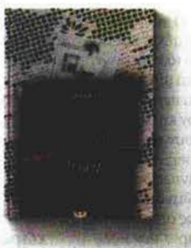
Το εξώφυλλο του κοινωνικού μυθιστορήματος του Π. Μπλίτση.