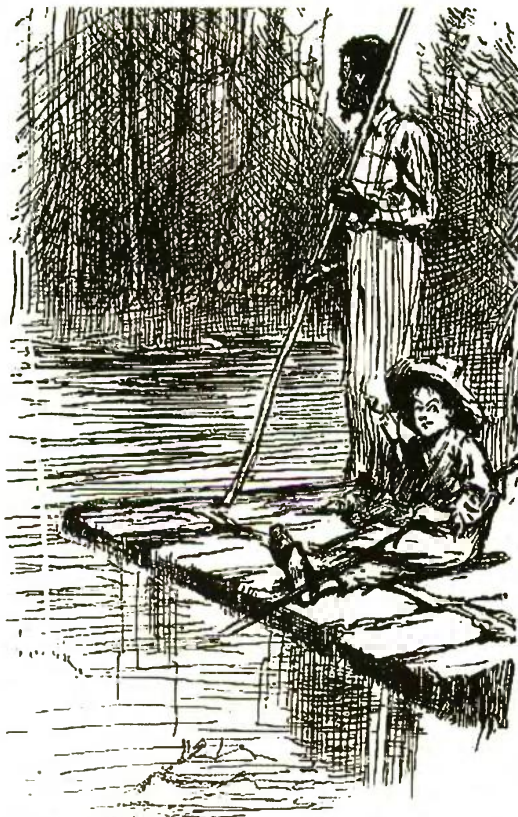
ON THE RAFT.

Ο σκλάβος Τζέιμς, όπως τον αναπαθεί ο Εβερρετ, είναι μορφομένος, ικανός να διαβάζει και να γράφει αλλά το κάνει μόνο στα κρυφά. Έχει δημιουργήσει μια διαφορετική περσόνα για να αποκτήσει την πνευματική του καλλιέργεια, ένα είδος «φίτρου σκλάβου» που το υιοθετεί για να επιβιώσει. Σε έναν κόσμο όπου η εξιχνία ενός μαυρού άντρα θεωρείται απειλή, ο Τζέιμς