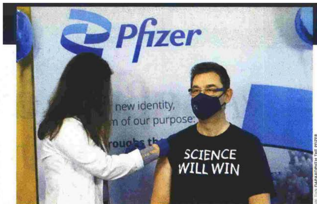
Ο Αλμπερτ Μπουρλά ενώ κάνει την πρώτη δόση με το εμβόλιο της Pfizer στις εγκαταστάσεις της εταιρείας στο Περλ Ρίβερ, στις 16 Φεβρουαρίου του 2021

και τελικά αποδεικνύει ότι η περιπέτεια για τη δημιουργία του εμβολίου ήταν κάτι πέρα από μια τεράστια νίκη της επιστήμης, ήταν ένα απρόσμενο δώρο προς την ίδια την ανθρωπότητα: