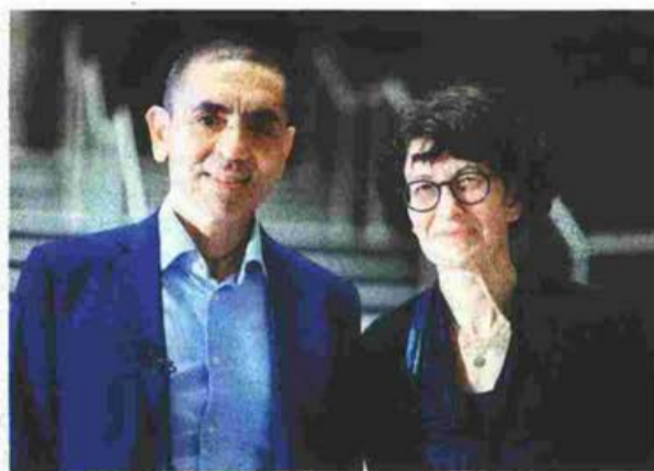
Ο Ουγκούρ Σαχίν και η Εζλέμ Τουρετζί της BioNTech. Ο Μπουρλά απέκτησε τρομερή χημεία με τον Τούρκο ιδιοκτήτη της γερμανικής εταιρείας με θετικό αποτέλεσμα για όλο τον κόσμο